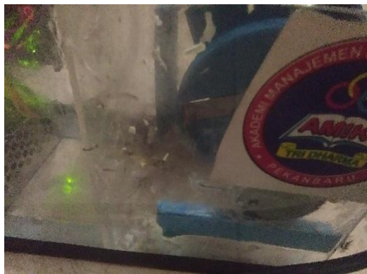
Gambar 5. Hasil potongan bawang