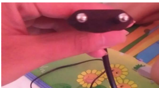
Gambar 2. Menghubungkan Stop Kontak Ke Mesin Pengiris Bawang